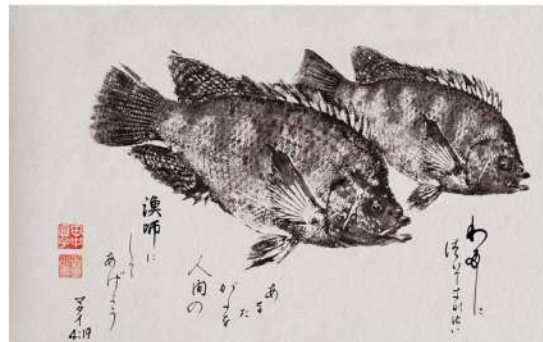
Gyotaku (ichthyogramme) est un art japonais consistant à reproduire des empreintes de poissons sur différents supports tels que du papier ou du tissu. Cette méthode était utilisée par les pêcheurs pour immortaliser leurs plus belles prises.