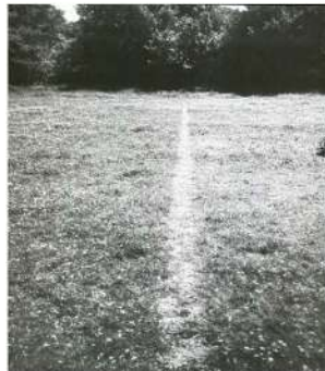
Richard LONG, A Line Made by Walking, 1967, photographie, 37,5 x 32,4 cm, MoMA, NY.