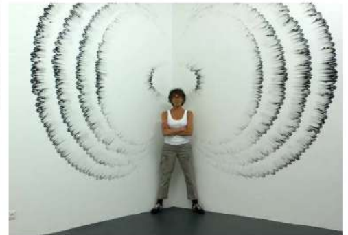
Judith BRAUN, FINGERING #4, 2010, dessin au charbon avec les doigts sur un mur, 304 x 460 cm.