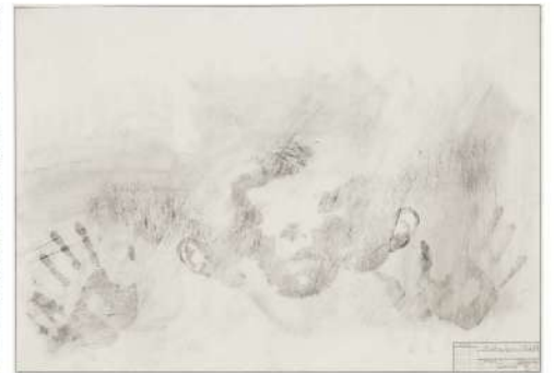
Jasper JOHNS, Study for skin, 1962, charbon sur papier, 55,9 x 86,4 cm, Collection de l'artiste, MoMA, NY.