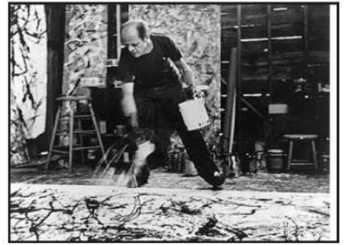
Atelier de Pollock - photographie de Hans Namuth; Les photos en noir et blanc permettent de suivre avec précision la posture et les gestes du peintre, et sa technique du dripping