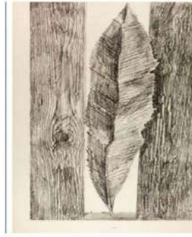
Max Ernst - Les mœurs des feuilles, 1926, 34 planches - Frottage reproduit en phototypie - 50 x 32,4 cm

Les traces s'inscrivent sur tous types de surface (mur, sol, corps...) exploitent tous types de matériaux (peinture, pigment, encre, terre, bois...) mettent en oeuvre des techniques variées (gravure, frottage, dripping...) autant d'occasions de produire des oeuvres aux effets multiples et sensibles.