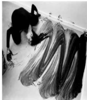
Janine ANTONI, Loving Care, performance, Londres, 1993.