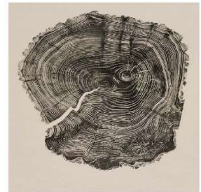
Bryan Nash GILL, Willow (Woodcuts), 2011, empreinte d'une coupe de tronc sur papier, 97,5 x 126 cm.