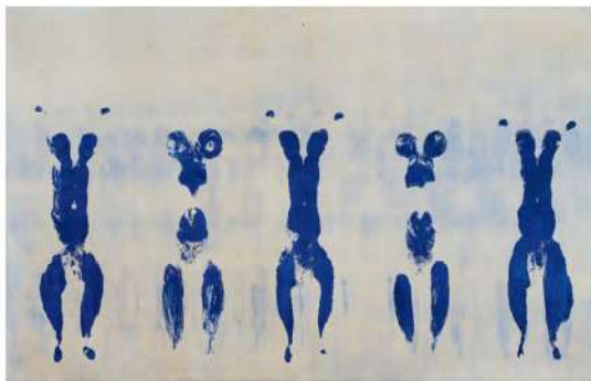
Yves KLEIN, Anthropométrie de l'époque bleue (ANT 82), 1960, pigment pur et résine synthétique sur papier monté sur toile, 155 x 281 cm.